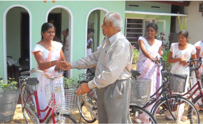
FPA ශ්‍රී ලංකා ආයතනයේ හිටපු සභාපති මේජර් ජේෂ්ව සිල්වා මහතා බයිසිකල් ප්‍රදානය කරන අවස්ථාව

ලාභනු ලබන සෞඛ්‍ය වෛද්‍ය නිලධාරී කොට්ඨාසයේ ස්වේච්ඡා සේවිකාවන් 25 දෙනෙකු සඳහා බයිසිකල් පිරිනමන ලදී. මෙම පිරිස ප්‍රදේශයේ පවුල් සෞඛ්‍ය සේවා නිලධාරීන්ගේ කාර්යයන්ට සහය ලබාදේ.