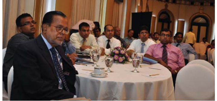
සහනශීලී වදිවත් පිරිසෙන් කොටසක්